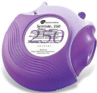
세레타이드 디스크스 (Seretide Diskus)